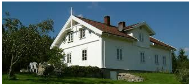
Hovedbygningen på Nord Hammeren er bygget i 1844