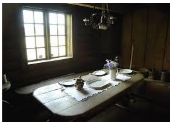
Illustrasjon – bordoppdekning 1800 tallet.