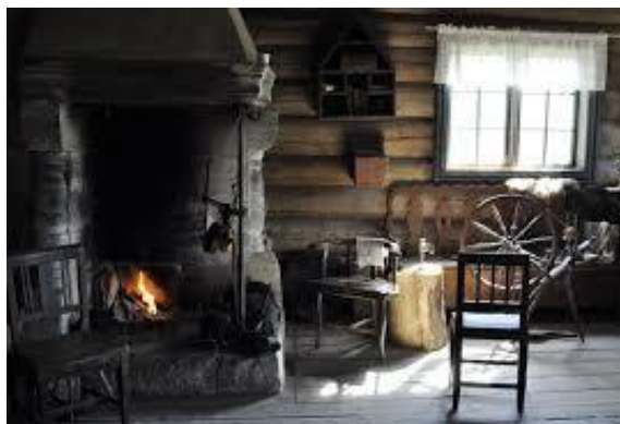
Illustrasjon – bondestue 1700 tallet.