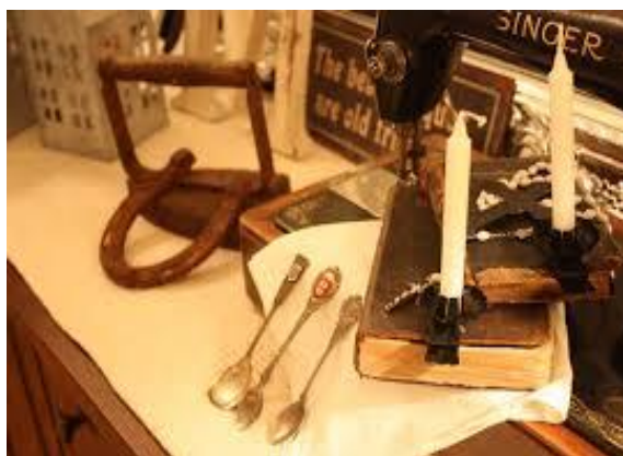
Illustrasjon – gamle gjenstander 1800-1900 tallet.