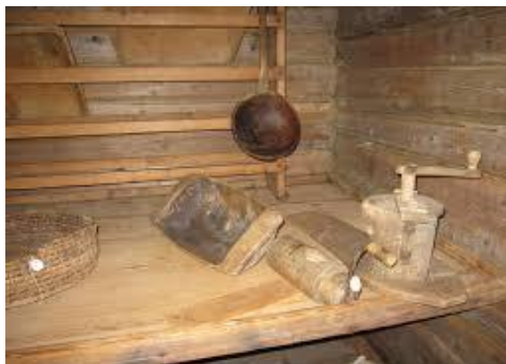
Illustrasjon – gamle kjøkkenredskap 1700-1800 tallet.