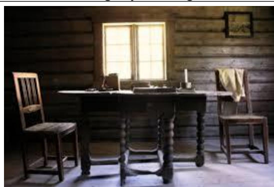
Illustrasjon – bondeinnredning