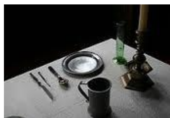
Illustrasjon – bordoppdekning 1700 tallet