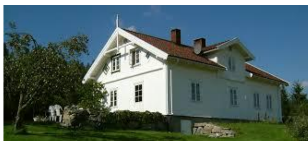
Hovedbygningen på Nord Hammeren er bygget i 1844