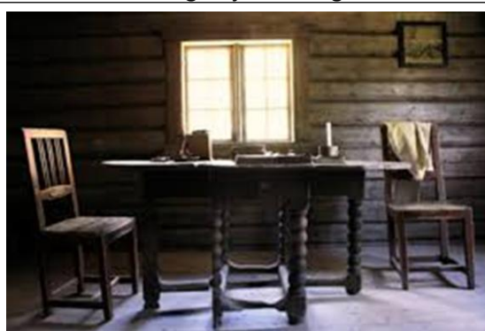
Illustrasjon – bondeinnredning