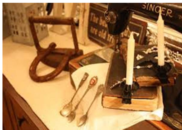
Illustrasjon – gamle gjenstander 1800-1900 tallet.