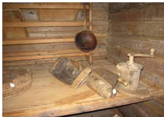
Illustrasjon – gamle kjøkkenredskap 1700-1800 tallet.