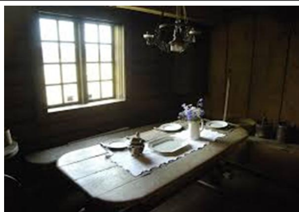
Illustrasjon – bordoppdekning 1800 tallet.