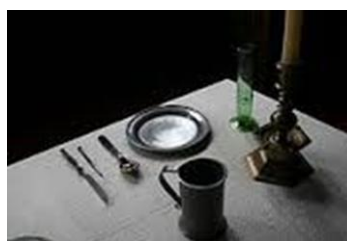
Illustrasjon – bordoppdekning 1700 tallet