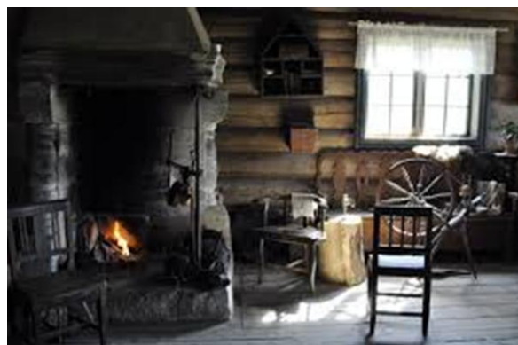
Illustrasjon – bondestue 1700 tallet.