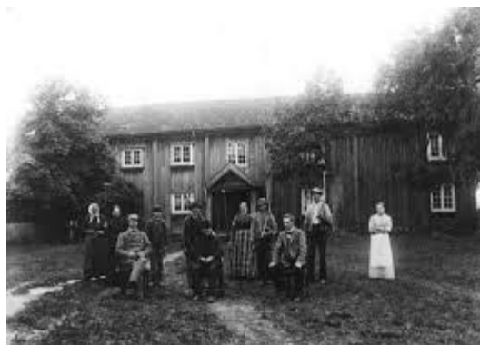
Asak Nordre i Sørum i slutten av 1890 årene

De første kjente brukerne på Asak-gårdene er nevnt i skattelister fra 1593 og fremover. Til midten av 1700-tallet var bøndene på Asak leilendinger. Siden Asakgårdene var blant de store i bygda, ble brukerne her utvilsomt regnet blant de større bøndene i bygda, selv om de ikke eide gårdene sine selv. På den tiden hadde selveiere og leilendinger samme posisjon i bygdesamfunnet – uavhengig av eierforholdet til gården. I en stor rettsak fra 1680 – 1685 om grensene mellom Asak og nabogårdene Vilberg og Refsum ble det avgitt nesten 100 vitneprov. Gjennom disse vitnemålene rulles det opp flere slekts-sammenhenger som vi ellers ikke hadde hatt oversikt over, hvis det ikke var for denne rettsaken. Noen antydes og noen kan tolkes på flere måter. Det kan se ut som om den første kjente brukeren på Asak Nordre hadde mange barn og etterkommere. Det er mange sannsynlige og mulige barn som er ført opp. Det er bare de sikre familierelasjonene som jeg har tatt med her.