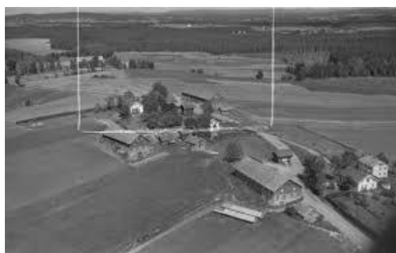
Flyfoto - Asak Nordre i Sørums 1956

Fra slutten av 1600 tallet ble gården Asak Nordre delt fast i 2 bruk, et søndre og et nordre.