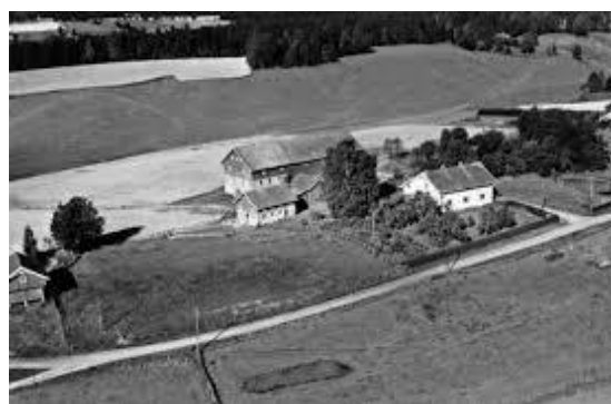
Flyfoto - Asak Nordre i Sørums 1951